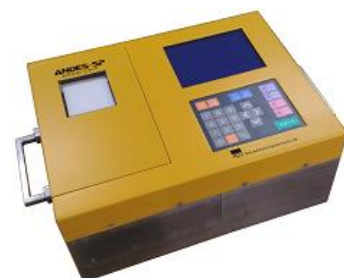
図-2 新型 RI 計器 (製品名 ANDES-SP)